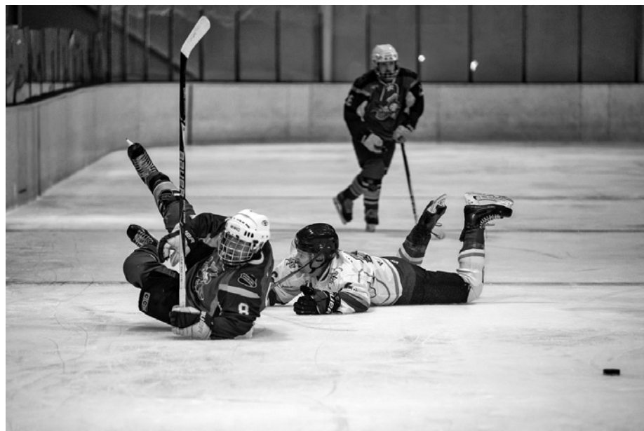
“Poza” (autors Gatis Vilbrants).