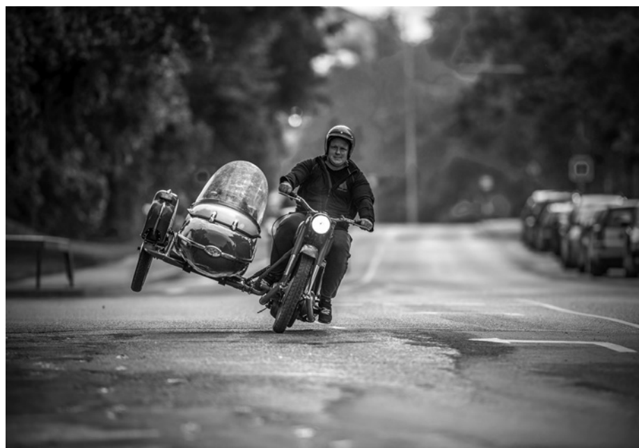
“Iela” (autors Gatis Vilbrants).