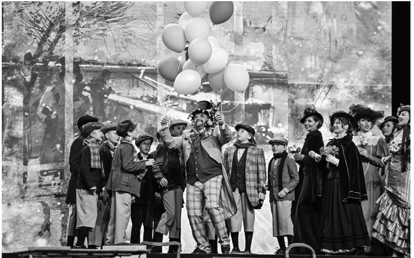
Skats no izrādes “Bohēma” Siguldas pilsdrupās 2022. gada opermūzikas svētkos.

E. Freibergam “Bohēma” ir sestais iestudējums Siguldas opermūzikas svētkos. Tas esot ārkārtīgi ietilpīgs darbs, kuram pusgadu jāgatavojas, lai nedaudzajos mēģinājumos uz vietas visu paveiktu. Pēc režisora teiktā, “Bohēma” ir stāsts par mīlestību – likteņa vai Dieva dāvanu, ar kuru bieži vien apejamies nesaudzīgi un tikai kritiskā situācijā, kad mīlētājiem jāatvairās, ja vienam jāiet nāvē, pa istam spējam novērtēt šīs jūtas. “Tā ir muzikāla drāma, un tas ir īpašs noteikums režisoram. Ļoti precīzi jāiestrādā visi psiholoģiskie