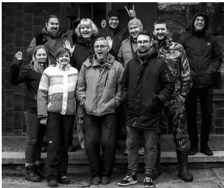
Gandrīz klases foto. Saldus fotoklubs “Es daru” šoziem plenērā Dobelē.